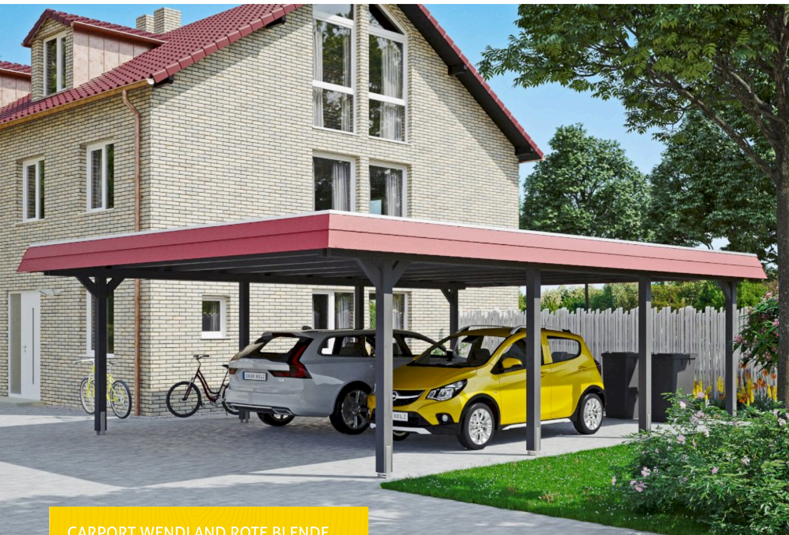
CARPORT WENDLAND ROTE BLENDE 630 x 879 cm