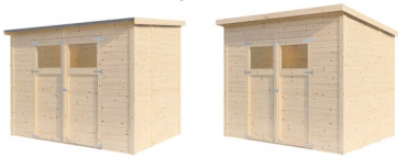
Flex Roof System