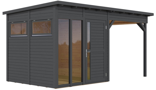
Behandlung: ANTHRAZIT (RAL 7016)

Nachbehandlungen können mit beliebigen Farbtönen erfolgen.