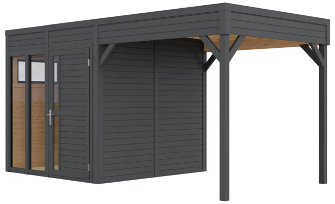
Behandlung: ANTHRAZIT (RAL 7016)

Nachbehandlungen können mit beliebigen Farbtönen erfolgen.