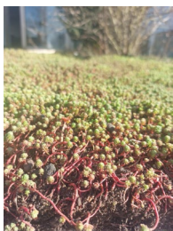
Urban Scape Sedum Mix Vegetationsmatte