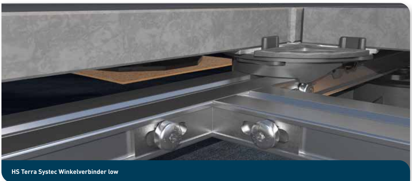
HS Terra Systemec Winkelverbinder low