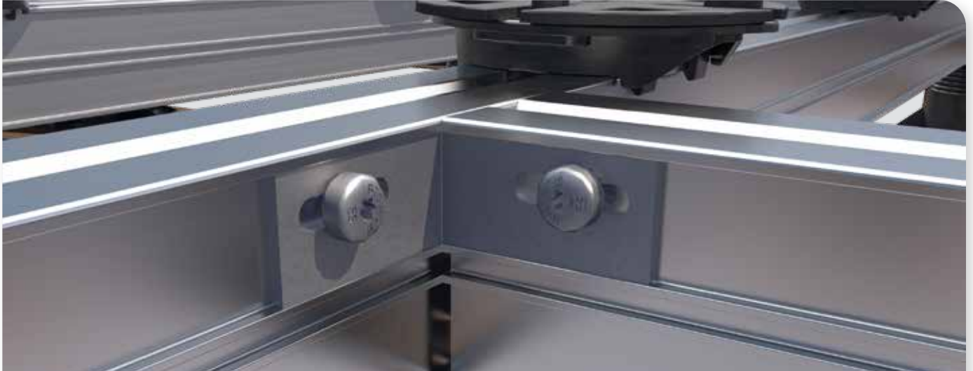
HS Terra Systec Winkelverbinder high