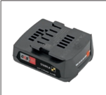
12 V LI-Power 2.0 Ah CAS-Akku Artikel-Nr. 19625