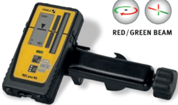
RED / GREEN BEAM