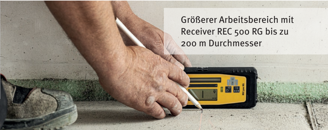
Größerer Arbeitsbereich mit Receiver REC 500 RG bis zu 200 m Durchmesser