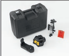
LAX 600, 5-teiliges Set Art. Nr. 19788 Laser LAX 600, Universalhalterung SUB 10, Wandhalterung SWB 10, Zieltafel, Tragekoffer