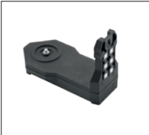
SUB 10 Universal- halterung Artikel-Nr. 19815