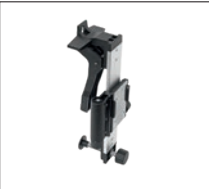
SWB 10 Wandhalterung Artikel-Nr. 19814