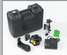
LAX 600 G, 7-teiliges Set Laser LAX 600 G, CAS-Akku 12 V LI-POWER 2.0 Ah, CAS-Ladegerät SC 30, Universalhalterung SUB 10, Wandhalterung SWB 10, Zieltafel, Tragekoffer