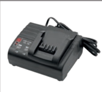
SC 30 CAS-Ladegerät Artikel-Nr. 19628 (EU) 19627 (UK) 19626 (AU)