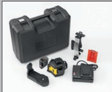
LAX 600, 7-teiliges Set Laser LAX 600, CAS-Akku 12 V LI-POWER 2.0 Ah, CAS-Ladegerät SC 30, Universalhalterung SUB 10, Wandhalterung SWB 10, Zieltafel, Tragekoffer