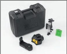
LAX 600 G, 5-teiliges Set Art. Nr. 19794 Laser LAX 600 G, Universalhalterung SUB 10, Wandhalterung SWB 10, Zieltafel, Tragekoffer