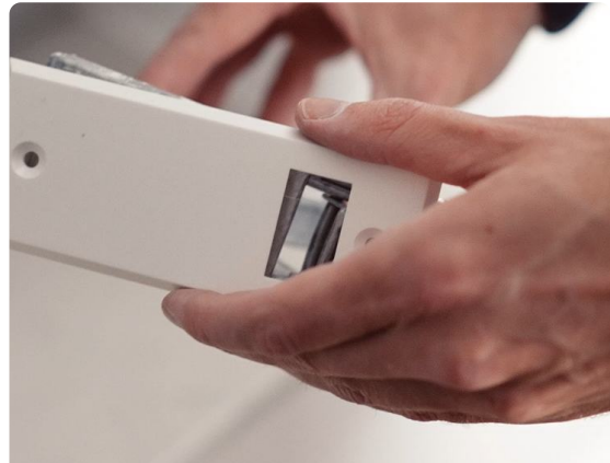
6. Abdeckplatte austauschen