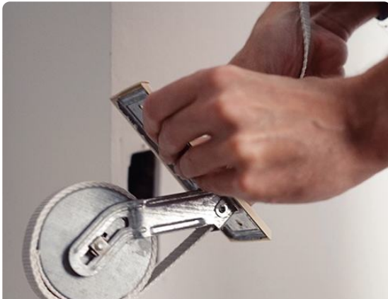
5. Rollladengurt entfernen

Mit Entnahme des Gurtbandes können Sie nun die alte Abdeckplatte mit der neuen Abdeckung wechseln. Haken Sie im Anschluss das Gurtband an die Gurtrolle ein und drücken Sie die Sicherung vorsichtig wieder herunter. Halten Sie bei diesem Vorgang die Abdeckplatte mit dem Gurtwickler immer fest zusammen. Der Rollladengurt kann langsam am Gurtwickler wieder angebracht werden.