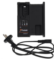
Artikel-Nr. 018881 Impulse Lithium Ladegerät