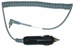
Artikel-Nr. 900507 Kfz Ladekabel