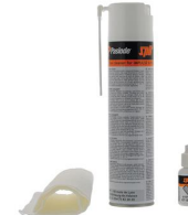
Artikel-Nr. 013690 Impulse Reinigungsset