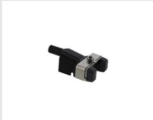
Artikel-Nr. 019783 Nase empf. Oberfläche Xi