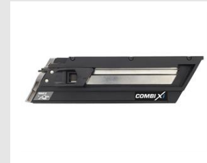
Artikel-Nr. 014029 Wechseltmagazin für Ankernägel (MAG2) Paslode IMPULSE 2-in-1 Kombi- Nagler COMBI Xi