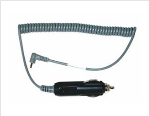
Artikel-Nr. 900507 Kfz Ladekabel