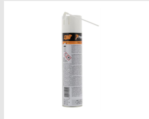
Artikel-Nr. 115251 Reinigungsspray (300 ml)