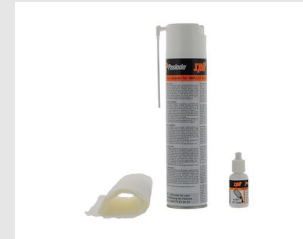
Artikel-Nr. 013690 Impulse Reinigungsset