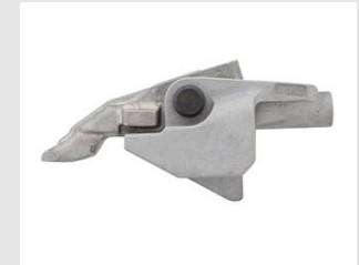
Artikel-Nr. 014032 Nase COMBI Xi für Metall-Holz