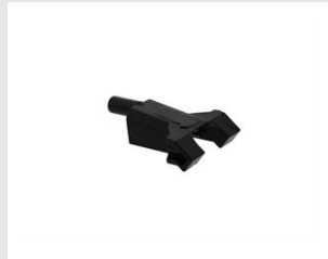
Artikel-Nr. 019784 Nase verd. Fussbodennag. Xi