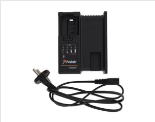
Artikel-Nr. 018881 Impulse Lithium Ladegerät