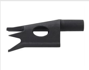
Artikel-Nr. 019278 Nase COMBI Xi für Holz-Holz