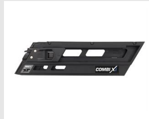
Artikel-Nr. 014028 Magazin für Streifennägel (MAG1) Paslode IMPULSE 2-in-1 Kombi-Nagler COMBI Xi