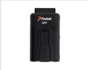
Artikel-Nr. 018880 Impulse Lithium Akku