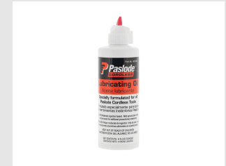
Artikel-Nr. 401482 Impulse Öl (115 ml)